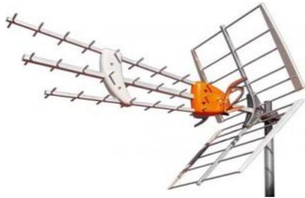
ANTENNE RATEAU STANDARD