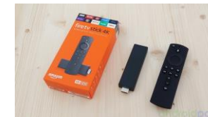
AMAZON LA FIRE TV

Soit votre tv n'est pas connectée et vous pouvez vous payer une clef streaming (moins chère) qui se branche sur un port HDMI ( la fire tv d'amazon ou la google chromecast ) sont les plus connus mais il en sort d'autre)