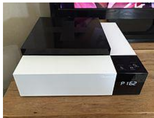
BOX CANAL+ ASTRA 19.2

Connection internet nécessaire ! Elle vous est louée pour environ 15 euros par mois en + de votre abonnement