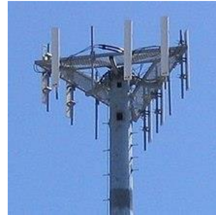
EMETTEUR GSM 4G