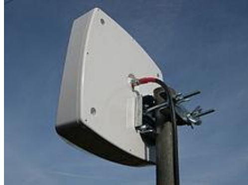
ANTENNE HERTZIENNE CARRE