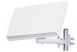
Parabole plate Irréparable !