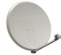
Parabole Standard Tête remplaçable