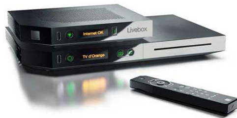
BOX ORANGE ASTRA 19.2

Connection internet nécessaire ! Elle vous est louée pour environ 15 euros par mois en + de votre abonnement